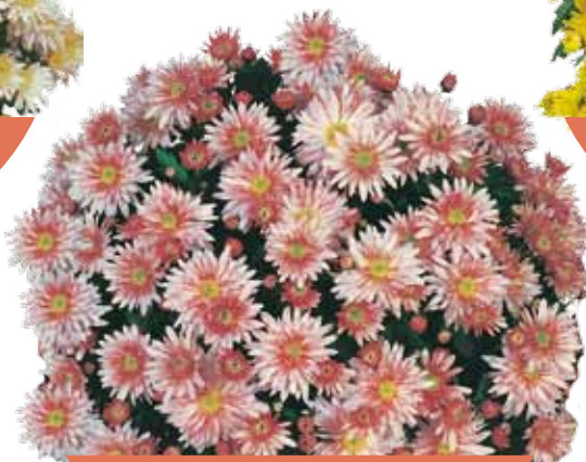
MME NICOLE FALCE ROSE ®