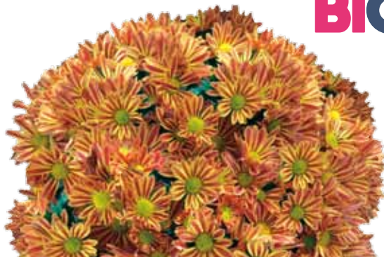
CHARLESTON ROUGE ®