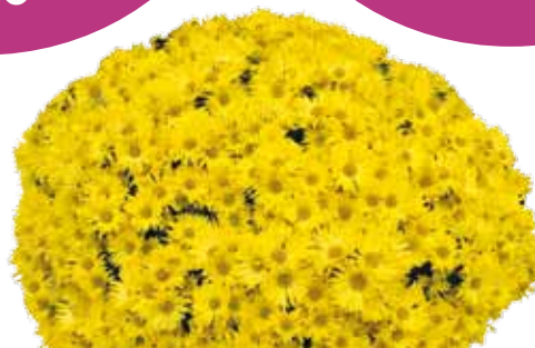
PALIDORO GIALLO ®