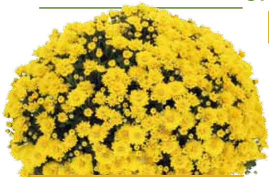
EGLANTINE JAUNE ©