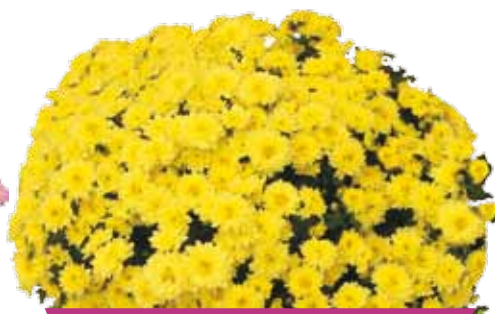
GAETA GIALLO ®