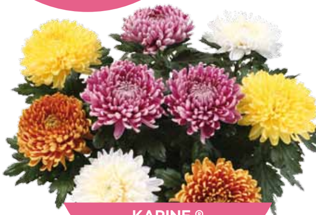
KARINE ® JAUNE - BLANC ROSE - CUIVRE