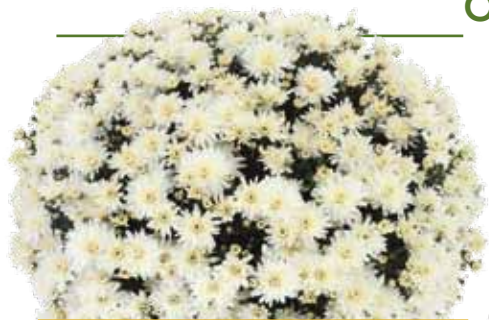
BALCONET BLANC ®