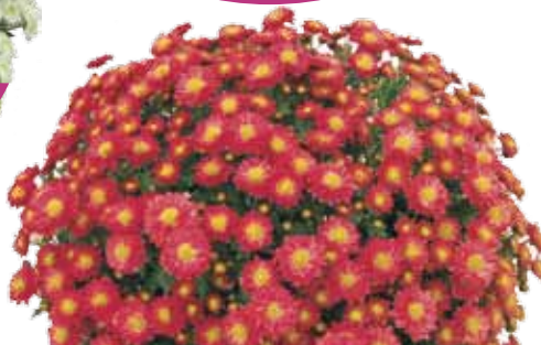
GAETA ROSSO ®