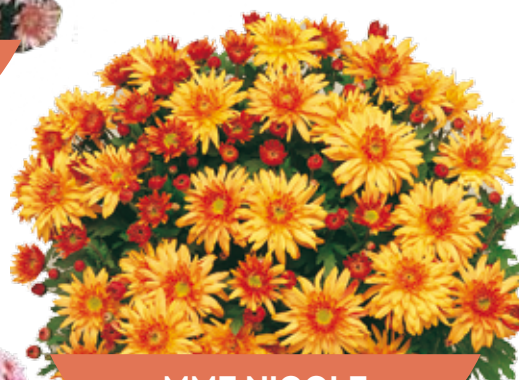
MME NICOLE FALCE CUIVRE ®