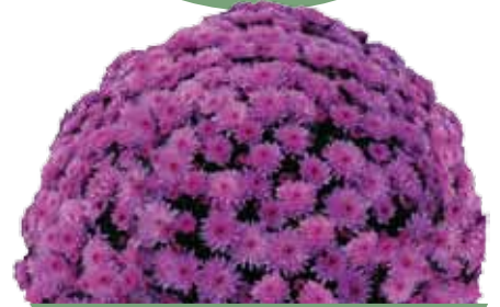
BRANFOUNTAIN PURPLE ®