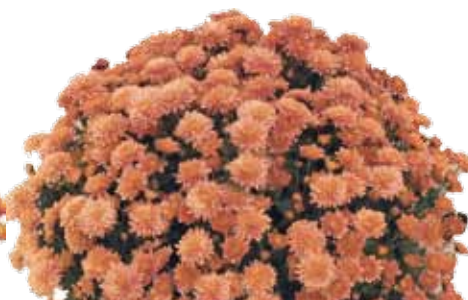
GAETA BRONZO ®