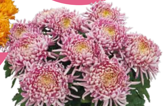
DIANA PINK ®