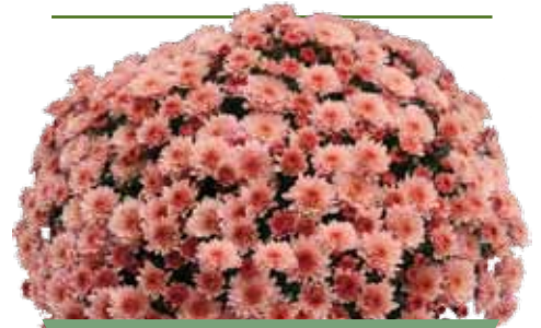
BRANFOUNTAIN SALMON ®