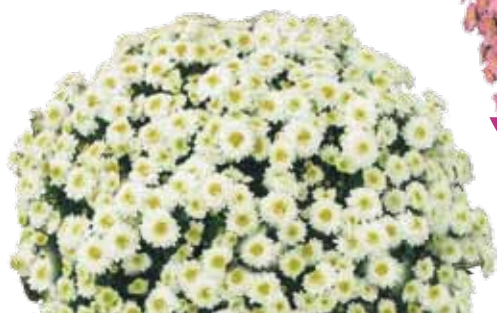
GAETA BIANCO ®