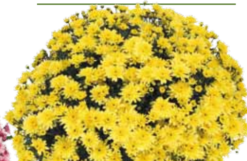
BALCONET JAUNE ®