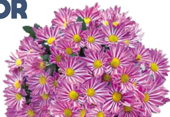
CHARLESTON ROSE ®