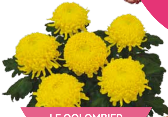
LE COLOMBIER JAUNE ®