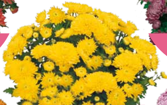
CHAMA GIALLO ®