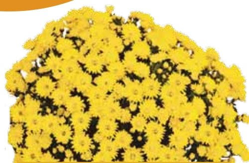
LE GLAINE JAUNE ©