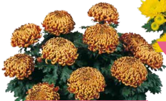
BENEDICTE ROUE ®