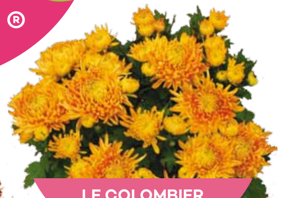
LE COLOMBIER DORÈ ®