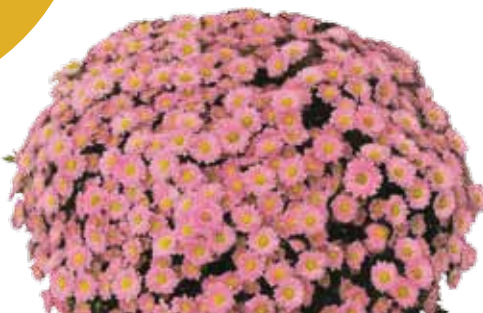
GAETA ROSA ®