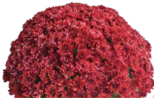
NOCTURNE ROUGE ©