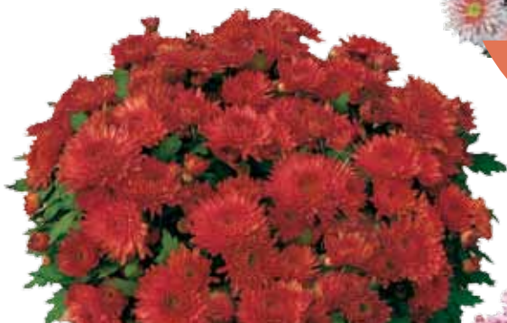
MME NICOLE FALCE ROUGE ®