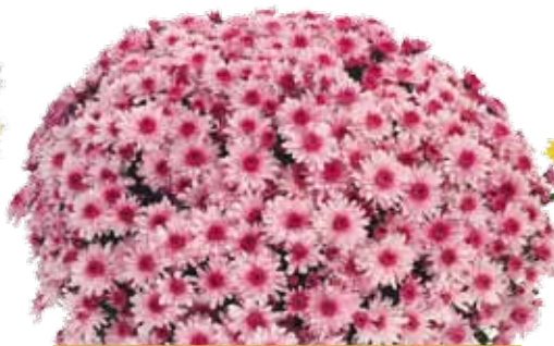
BALCONET ROSE ®