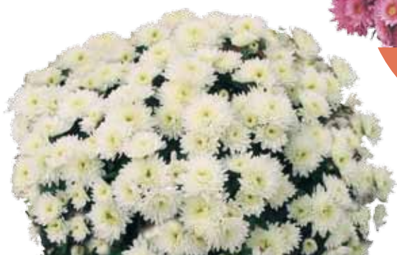
NEIGEUSE BLANC ®