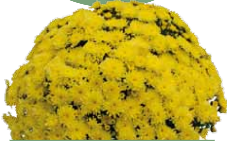
BRANFOUNTAIN YELLOW ®