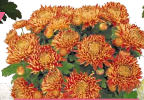
LE COLOMBIER ROUGE ®