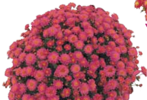
GAETA LILLA ®