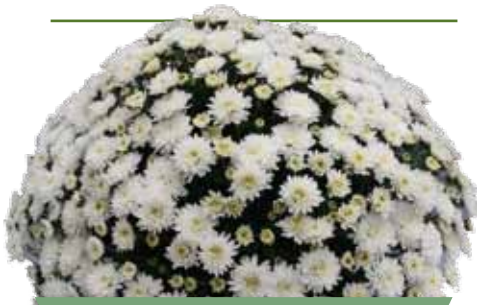
BRANFOUNTAIN WHITE ®