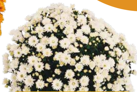
LE GLAINE ©