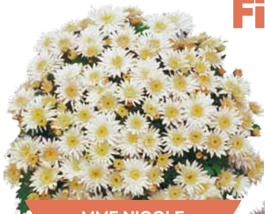
MME NICOLE FALCE BLANC ®