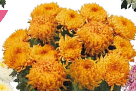
DIANA ORANGE ®