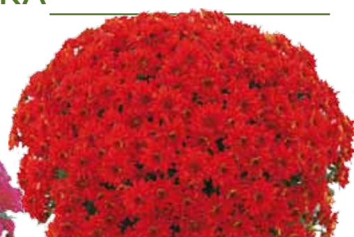
CARESSE DES VELOURS ©