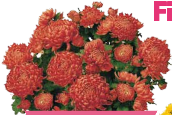
CHAMA ROUGE ®