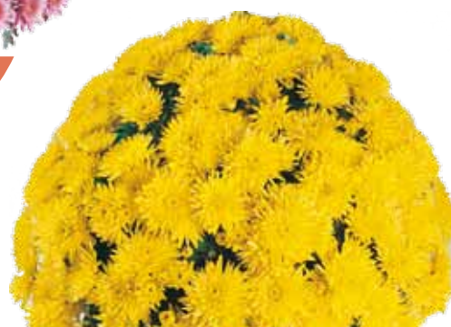
NEIGEUSE JAUNE ®