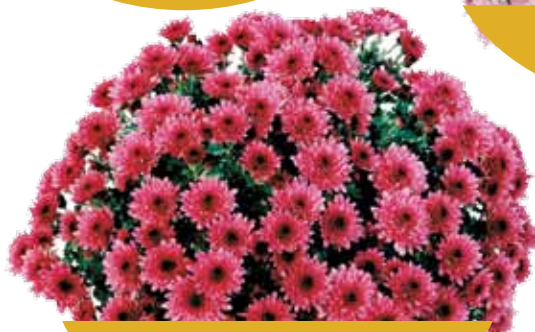
LA VAIGES ®