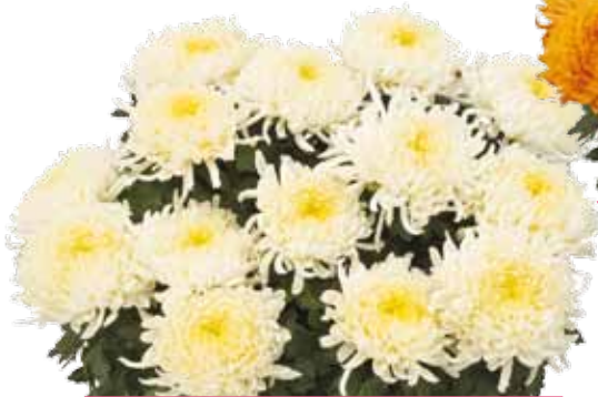
DIANA WHITE ®