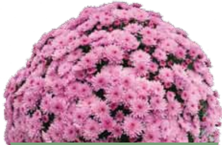
BRANFOUNTAIN PINK ®