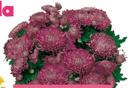
CHAMA VIOLET ®