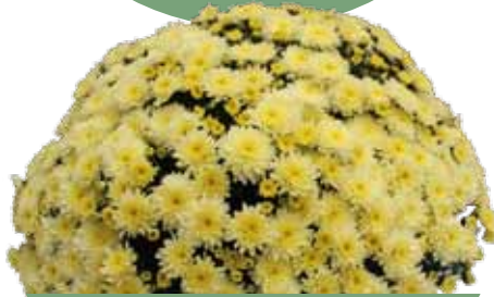
BRANFOUNTAIN LEMON ®