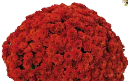
ANDALOU ROUGE ©