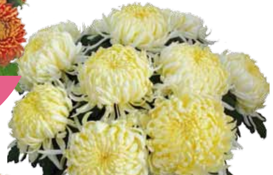
ANGELYS JAUNE ®